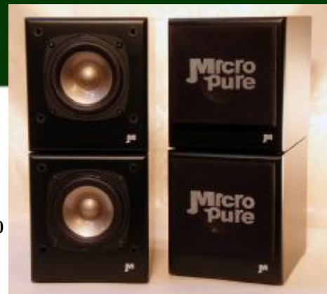
AP5001 II WIN-B