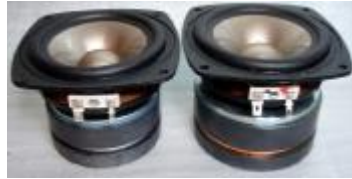
左 AP5001 II / 右 新開発 強力磁気回路搭載の専用 新ユニット

AP5001 II WINは従来のスタックモデルとは全く次元の異なる革新的なサウンドを、磁気回路が大型化された専用ユニットをマウントし、個別のダクトチューニングが施された専用キャビネットを AP5001 II に追加することで実現可能にした画期的なモデル。小型システムの域を超え、驚異的な情報量・反応性とシームレスな空間の支配力に、貴方はきっと時代の新たな変化を感じ取ることでしょ。