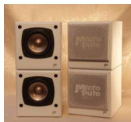
AP501 II WIN